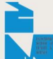
Egas Moniz School of Health & Science